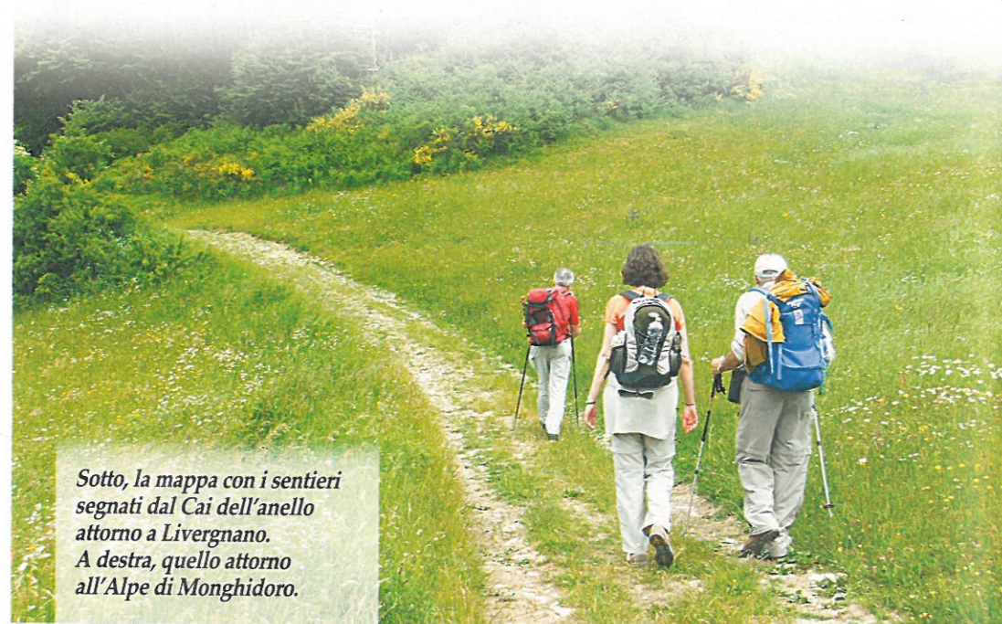
Sotto, la mappa con i sentieri segnati dal Cai dell'anello attorno a Livergnano. A destra, quello attorno all'Alpe di Monghidoro.

Si parte da Livergnano, nel comune di Pianoro, percorrendo con un po' di attenzione un tratto della Statale della Futa fino ad imboccare la stradina che porta a Sadurano, lungo il sentiero CAI 809 T5V (Traversata 5 Valli). L'anello è lungo