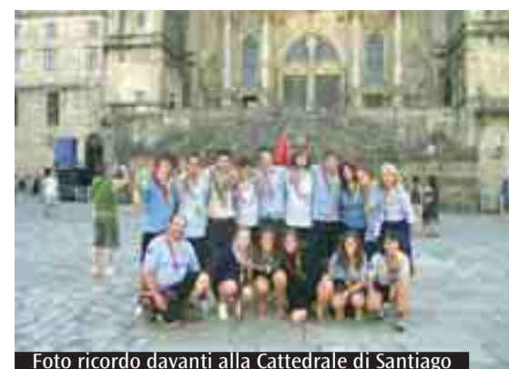
Foto ricordo davanti alla Cattedrale di Santiago

Tutto il viaggio è stato accompagnato anche dalla lettura del libro «Il Camino di Santiago», che ha suscitato in noi tutti curiosità, conoscenze, emozioni veramente importanti e ci ha aiutati a vivere questa esperienza in maniera concreta e profonda. Ora, rientrati a Castel S. Pietro, pur assillati dagli impegni quotidiani, ci siamo presi l'impegno di testimoniare questa importante esperienza sul sito internet che il nostro gruppo scout sta realizzando e che a settembre dovrebbe essere