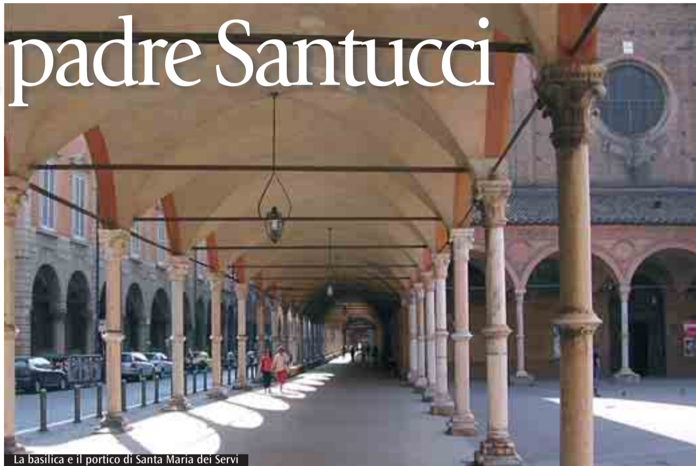
La basilica e il portico di Santa Maria dei Servi

1965, era quello di una liturgia solenne e partecipata dal popolo. Una liturgia in grado di valorizzare la grande tradizione liturgico-musicale del passato, ma aperta alle nuove forme dell'arte a servizio di una «liturgia viva per uomini vivi», a maggior gloria di Dio e per la santificazione di tutti i membri della Chiesa. Purtroppo, la secolarizzazione, il democraticismo e il relativismo culturale e morale hanno in gran parte compromesso il cammino della riforma voluta dal Concilio. Pertanto - come scrisse Giovanni Paolo II - bisogna ritrovare il «grande soffio» che sospinse la Chiesa al momento della promulgazione della Costituzione «Sacrosanctum Concilium», che tiene presente «con grande equilibrio la parte di Dio e quella dell'uomo, la gerarchia e i fedeli,