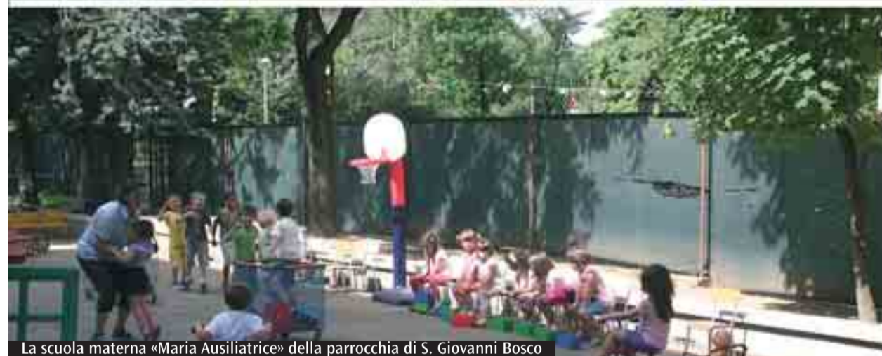
La scuola materna «Maria Ausiliatrice» della parrocchia di S. Giovanni Bosco