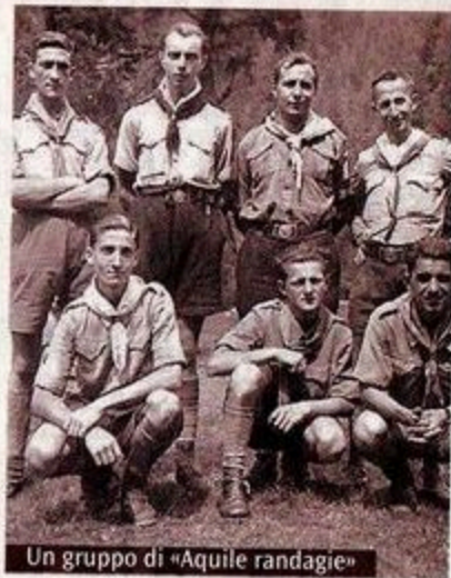
Un gruppo di «Aquile randagie»